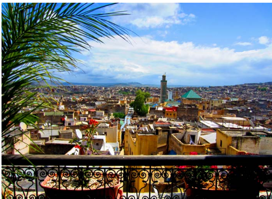
Поглед на медину у Фесу

Ручамо у ресторану у самој медини. Први пут пробам чувено јело кус – кус, које се служи у традиционалној посуди тажину. На крупном пшеничном гризу налазе се комади пилетине, али и режњеви кромпира и другог поврћа све то зачињено традиционалним зачинима, уз додатак сувог грожђа. После тумарања уским уличицама старог града у Фесу, где би се без нашег локалног водича сигурно изгубили коначно напуштамо овај људски мравињак од више од 150 хиљада становника (неки подаци говоре да овде живи и свих 500 хиљада) и упућујемо се на заслужни одмор.