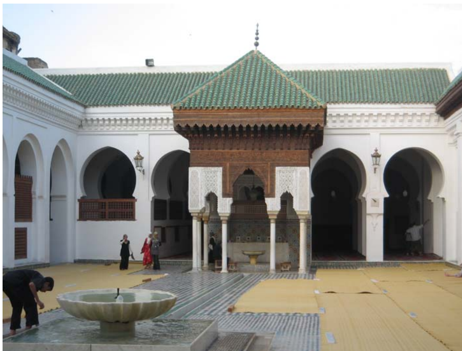
Универзитет Ал – Караоуине

Становници медине баве се занатима на исти, традиционални, начин као пре сто година, па тако, на пример, у кројачким радњама и радионицама увек раде мушкарци, јер је шивење мушки посао не само у Мароку, већ и у целом арапском свету. Али по женским правима, Мароко је јединствена муслиманска земља, јер су се Мароканке за своја права саме избориле, па данас имају најповлашћеније услове у читавом арапском свету.