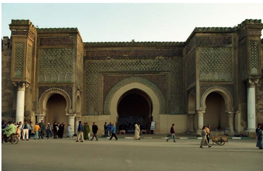
Врата Баб ел Мансур

Бербери су направили прво утврђено насеље у VIII веку око кога је израстао град који су утврдили Алморавиди у IX веку. Када су га касније заузели Алмохади обновили су га у још већи град са џамијама и утврдама. Почетком XIV века за владавине Меринида град је добио значајне медресе, утврде и џамије, а наставио се развијати и за време династије Ватсида.