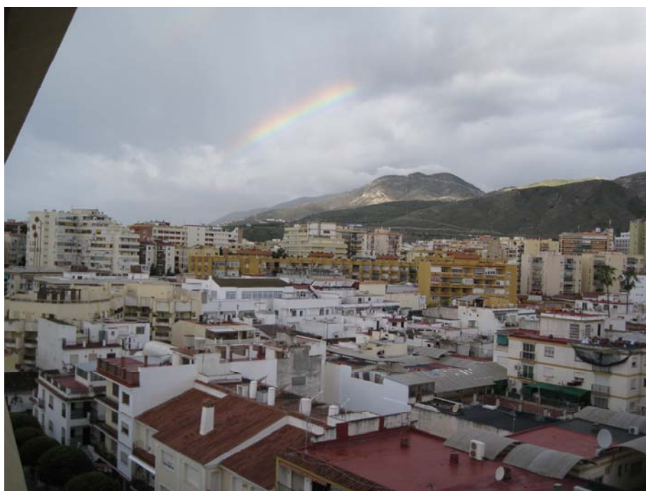
Поглед на Торемолинос са дугом

После доручка упућујемо се возом у Малагу. То је нека врста метроа, а станица у Торемолиносу је неких 200м удаљена од нашег хотела. Повратна карта до Малаге, која је последња станица на овој линији је 4 евра. Облачно је, али не личи на кишу. То нам обећава и дуга према обронцима Сијера Михаса.