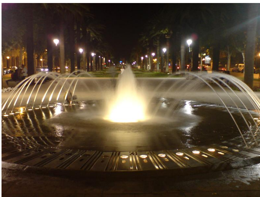
Центар новог Феса

Смештамо се у хотел „Волубилис“ у делу града који је изграђен током француске владавине. Хотел има базен, што нас неколико путника користи да се освежи. После одмора и вечере шетамо се до тржног центра Carrefour да купимо воду. Авенија у којој се налази наш хотел делује светски. По средини је пешачка алеја, тротоари су широки и чисти са бројним клупама за одмор шетача. На све стране ресторани. И наравно обиље зеленила.