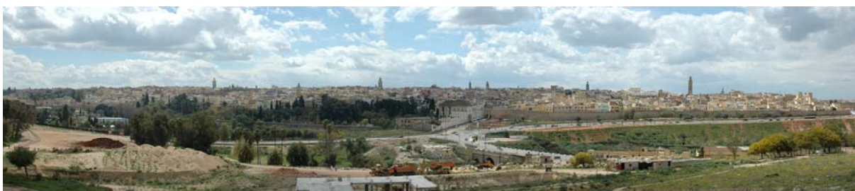
Поглед на Медину у Мекнесу са видиковца

У Мекнесу је подигао монументалне грађевине – царску палату, складиште хране и коњушницу од којих се у најбољем стању одржало складиште хране које је могло да обезбеди залихе хране за становнике Мекнеса током 20 година опсаде. У простору коњушнице, која је могла да прими 12 хиљада грла Мартин Скорсезе је снимао свој филм „Последње искушење Исуса Христа“. Пре обиласка ових објеката имали смо прилику да бацимо поглед на Мекнес и његов стари град или Медину како се овде каже за старо градско језгро, са видиковца. Мекнес је добио име по берберском племену Микнаса, које је доминирало овим подручјем у средњем веку. Стари град је на попису светске баштине UNESCO – а од 1996. године.