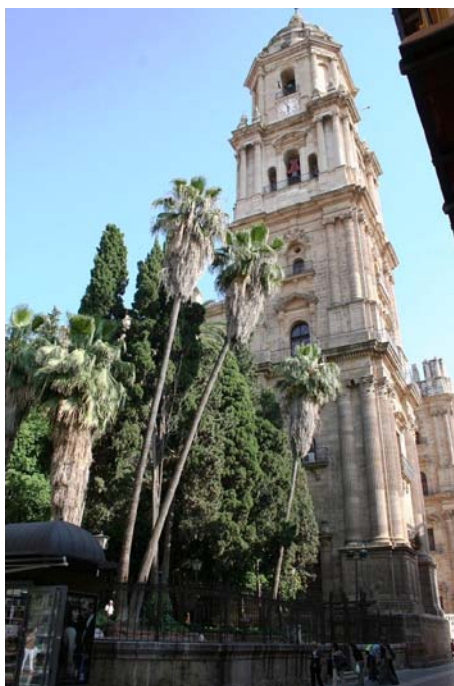
Катедрала у Малаги