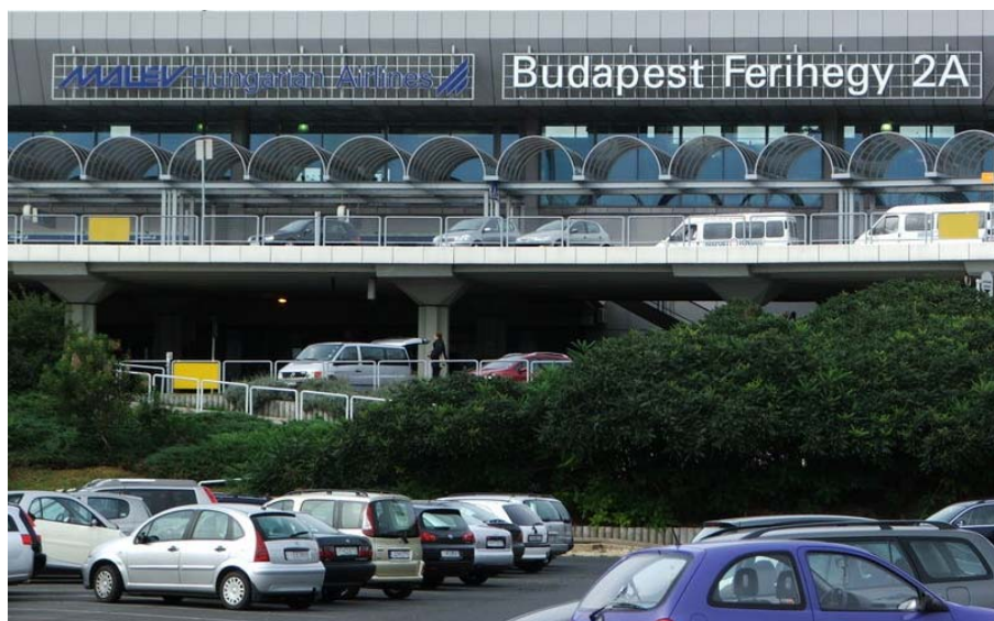
Аеродром у Будимпешти

Ради се о мом колеги са факултета, генерацију старијем, који сада живи у Данској. Аеродром у Будимпешти више није онај стари са кога сам летео 1986. године за Москву. Уместо старог назива Ferihegy аеродром се од 2011. године зове „Франц Лист“. Аеродром сада има пет терминала и ни по чему не заостаје за најмодернијим аеродромима Европе. Захваљујући томе аеродром у Будимпешти може да прими 15 милиона путника годишње. Процедура чекирања је углавном иста као раније, али имам утисак да су безбедоносне мере појачане. Осим тога баш смо се напешачили док нисмо стигли до авиона.