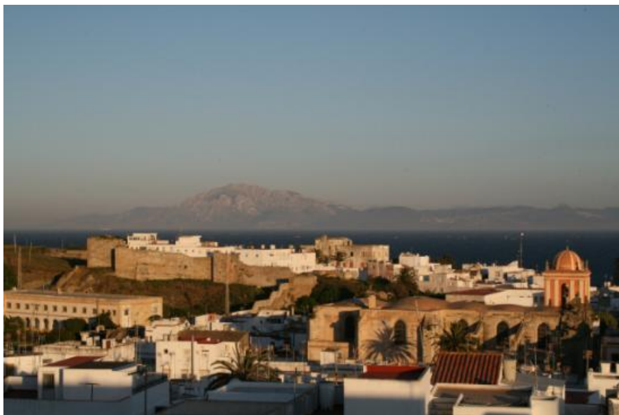
Тарифа са погледом на Африку

Тарифа је била под доминацијом муслимана од 710. до 1292. године када је после шестомесечне опсаде под вођством краља Санча IV од Кастиље утврђење пало. Рт Пунта де Тарифа (Punta de Tarifa) или како се још назива Пунта Мароки (Punta Marroscqi) је најјужнија тачка континенталног дела Европе.