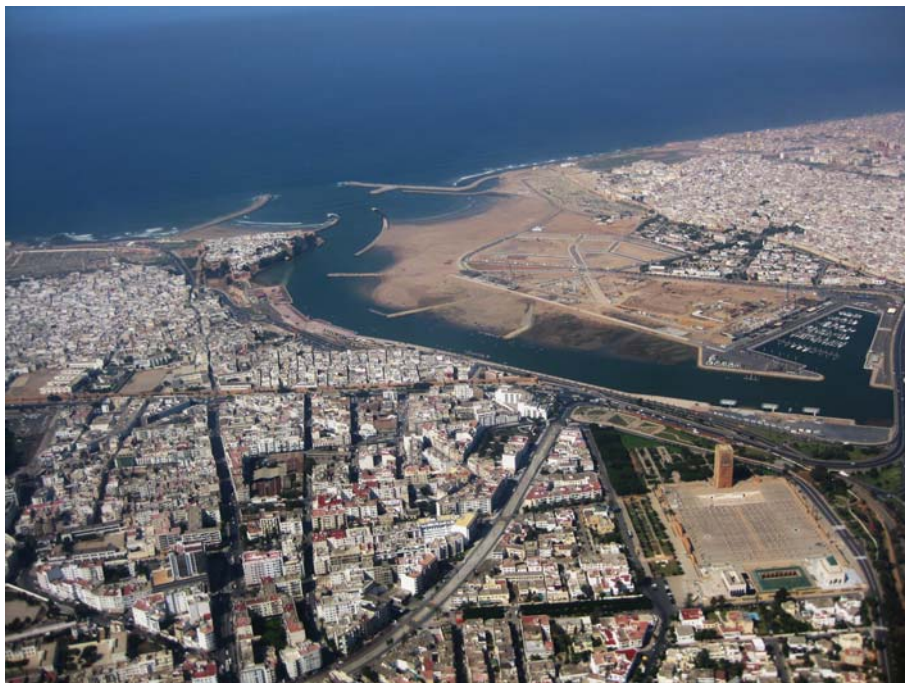
Панорама Рабата и Салеа

После обиласка и краћег боравка у Казабланки упућујемо се у Рабат, који се налази око 80км северније и главни је град Марока. По величини је други град Марока са својих око 1.6 милиона становника. Рабат се налази на ушћу реке Боу Регрег у Атлантски океан. Преко пута Рабата, с друге стране реке Боу Регрег налази се град Сале, који се административно води као посебан град, али је заправо спаваоница Рабата. Основао га је у XII веку Абд ал – Мумин, први алмохадски калиф као рибат (утврђену текију) за своју војску која је требало да крене у свети рат против Шпаније.