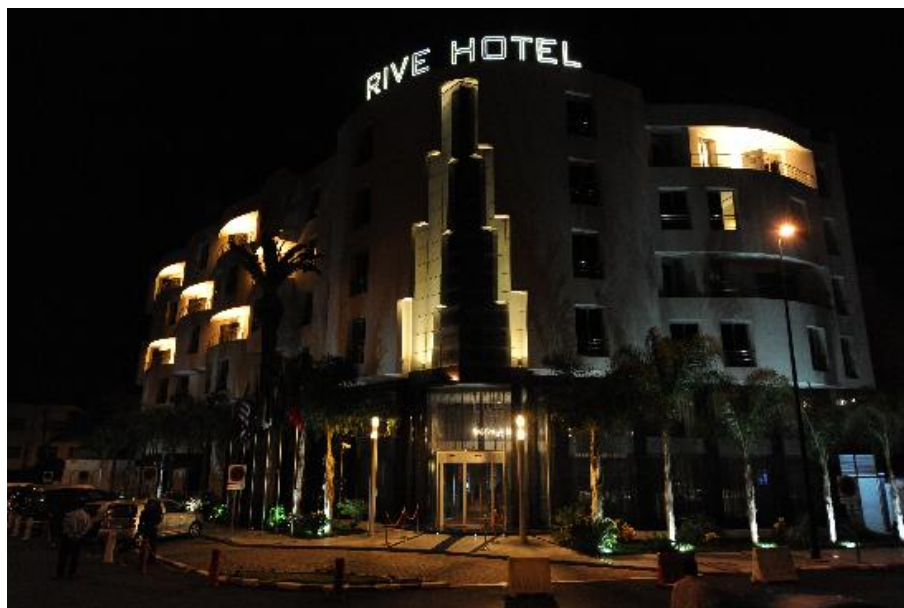
Хотел “Риве” у Рабату

Коначно се смештамо у хотел „Риве“, који ће бити наше последње коначиште у Мароку. После вечере покушавамо да направимо кратку шетњу по околини хотела, али врло брзо одустајемо и враћамо се на починак.