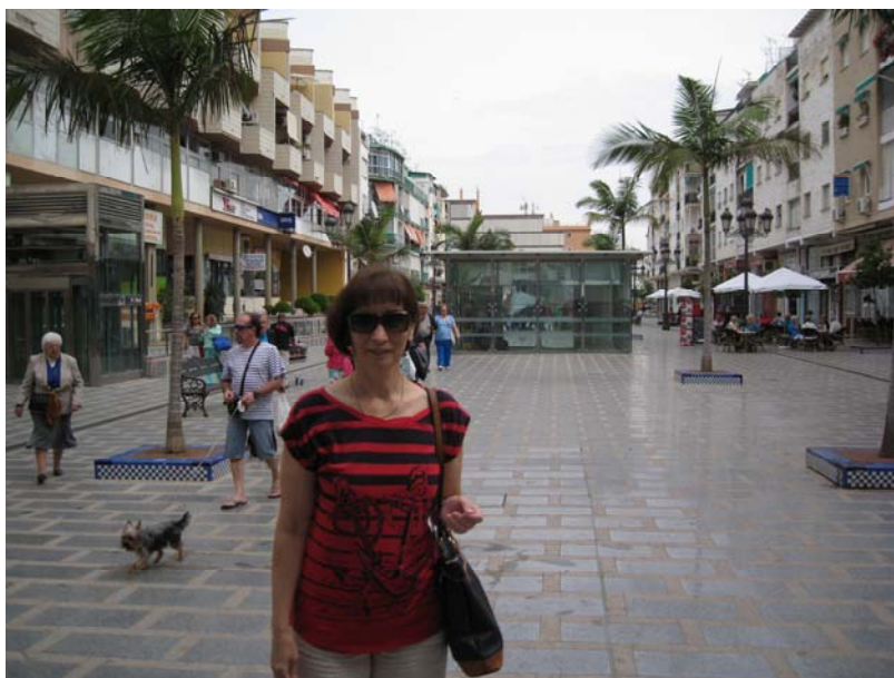
Пешачка зона у Торемолиносу

Торемолинос је веома популаран код Британских туриста, а има и бројну имигрантску популацију Британаца. Познат је по узбудљивом ноћном животу, посебно по бројним баровима и клубовима намењених LGBT заједници. Када је 1959. године отворен хотел Rez Espada био је то први луксузни хотел на целој ривијери. Следећих година нови хотели, ноћни клубови и други туристички објекти променили су лице Торемолиноса и његових плажа. Половином 60 – тих Торемолинос је постао значајно алтернативно туристичко одређиште. У Торемолиносу могу се наћи чувени Chirinos (ресторани на плажи) у којима се може појести свежа риба и плодови мора који су карактеристични за овај крај. Занимљиво је да је 2012. године McDonald's затворио свој ресторан у срцу Торемолиноса. Његов пример су следили KFC и Pizza Hut . Остао је само Burger King . Према броју гостију, поготову из реда локалног становништва изгледа да им не иде лоше.