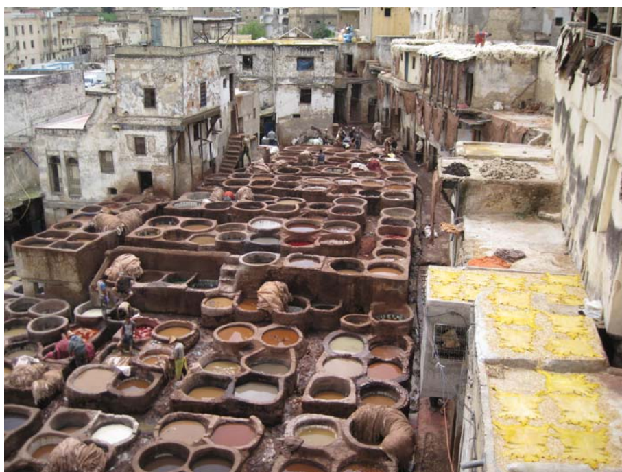
Погон за штављене и бојење коже у медини у Фесу

Медина Феса је највећа пешачка зона на свету и, подразумева се, никакво превозно средство не може да се користи. Осим магараца. Продавци, уобичајено мушкарци, обучени у целабе, у традиционалним жутим кожним папучама, углавном говоре француски, енглески слабије, а ако вам се поглед заустави на неком од производа, упорно ће ићи за вама не би ли вас заинтересовали да нешто купите. Пред погледима радозналих туриста занатлије на сребрним послужавницима ручно израђују орнаменте, у трошним “излозима” фасцинирају прелепи комади берберског сребрног и златног накита.