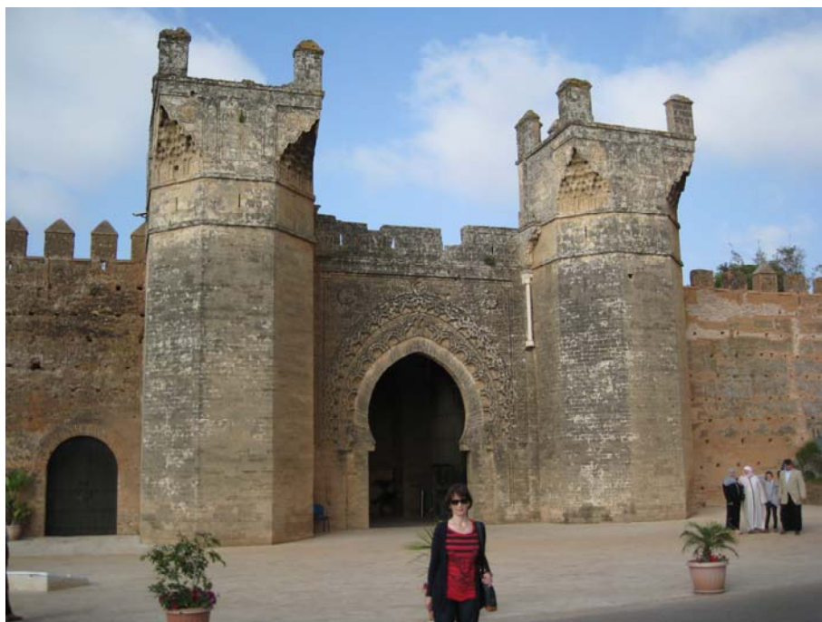
Испред комплекса Chella

Југоисточно од медине налази се значајан број историјских споменика. Међу њима је и Торањ Хасан са темељима никада довршене џамије. Недовршени минарет је достигао висину од 44м отприлике половину предвиђене висине од 86м. Остатак џамије је такође, остао недовршен са почецима неколико зидова и 200 стубова. Минарет, који је направљен од црвеног пешчара заједно са остацима џамије и модерним Маузолејом Мухамеда V чини важан историјски и туристички комплекс у Рабату.