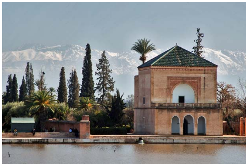
Павиљон у Менара врту са погледом на планинске венце Атласа

Павиљон и вештачко језерце се налазе усред плантаже воћа и маслина. Намена језера је била да обезбеди наводњавање плантаже коришћењем софистицираног система подводних канала званих qanat. Језеро је снабдевано водом захваљујући старом хидрауличном систему који допрема воду из планина које се налазе око 30км од Маракеша.