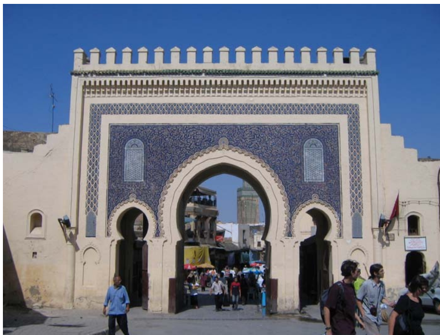
Плава капија на улазу у Фес ел Бали

После панорамског разгледања нових четврти и одласка на видиковац одакле пуца поглед на стари град одлазимо у обилазак Медине. Медина Феса (Фес ел Бали) је најстарији део Феса. Стари град, због својих традиционално уских улица, највеће је урбано подручје на свету без промета аутомобила, а истовремено је највећа Медина у исламском свету. Кад ступите ногом у Медину као да уђете у другачије стање, чула региструју све мирисе, и пријатне и исто толико непријатне, очи “зумирају” толико другачију, моћну и снажну колоритност овог чудесног места. Цео Мароко, изузев Казабланке и Рабата, је посебан, све покреће интензиван доживљај овог краљевства. По Плавој капији, која је један од улаза у Фес ел Бали, Фес се назива и „плавим градом“.