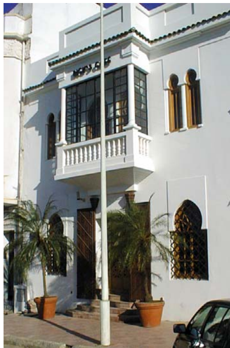
Риков бар у Казабланци