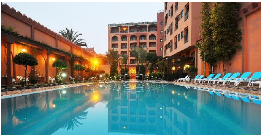
Хотел „Diwane“ у Маракешу