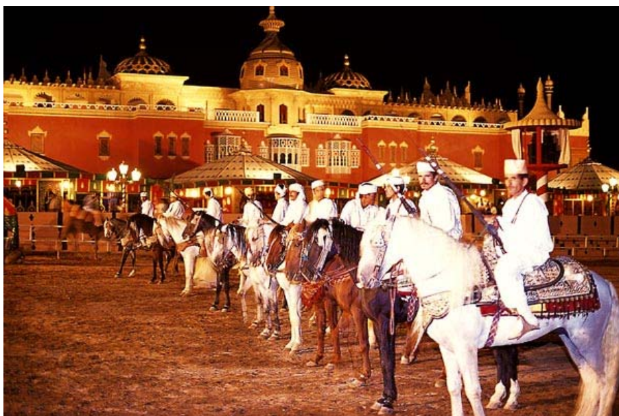
Chez Ali – Коњаници

За то време гости имају прилику да уживају у националној музици и програму из разних делова Марока. На крају вечери на простору са трибинама се окупљају гости како би гледали борбе и акробације коњаника, трбушни плес и друге елементе мароканске, пре свега берберске традиције. Спектакл се завршава ватрометом.