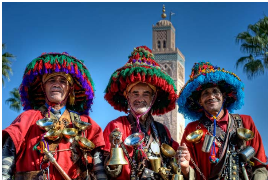
Продавци воде у Маракешу

Тргом доминирају тезге са поморанцама на којима се за само 40 – ак динара може купити сок од поморанци исцеђен пред вама. Оно што одмах упада у очи су продавци воде у живописној одећи са традиционаним мешинама са водом и месинганим шољама.