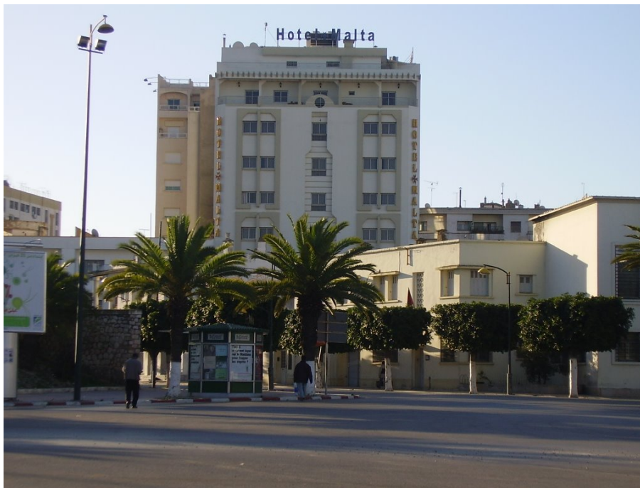
Хотел “Малта” у Мекнесу

У смирају дана међу брежуљцима коначно видимо кровове Мекнеса, који се сместио усред плантажа воћа и поврћа, посебно маслина. По доласку у Мекнес смештамо се у хотел „Малта“.