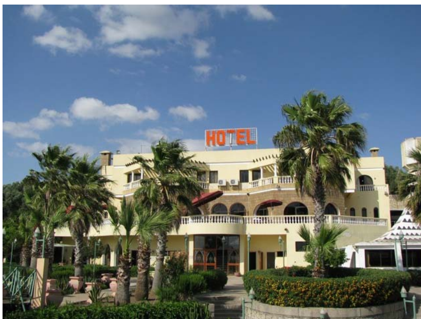
Хотел "Волубилис" у Фесу

Медреса ес Сахрија је најзанимљивији споменик у Андалузијској четврти у Фесу. У ствари ово се сматра за трећу најбољу Медресу у граду, одмах иза Боу Инаниа и ел Атарин. Изградио ју је 1321. године султан Абу ел Хасан, а у већој мери подсећа на ону у граду Мекнесу. Медреса је име добила по базену на коме је засновано њено двориште. У већој мери декорација овог здања је и даље оригинална и нетакнута. Предивне резбарије кедре потичу из времена Алмохада и Алморавида.