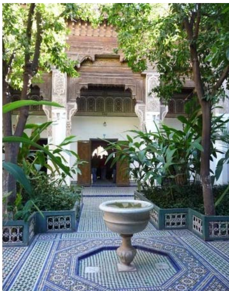
Двориште палате ел Бахија

Унутар минарета су направљене степенице да би се мујезин могао по њима петити на коњу. Џамија се налази око 200м западно од градског трга Ђема ел Фна. На шеталишту које излази на трг Ђема ел Фна могу се видети остаци оригиналне џамије из времена Алморавида.