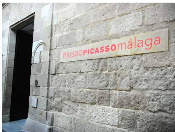
Улаз у Пикасов музеј

радова које су поклонили чланови Пикасове породице. Смештен је у здању Buenavista Palace.