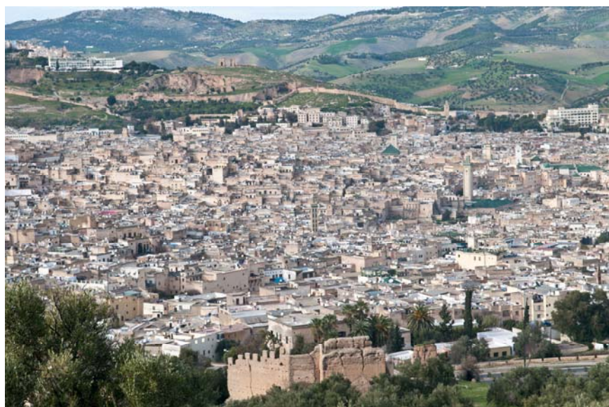
Панорама медине у Фесу

По завршетку обиласка Мекнеса одлазимо за Фес који је верско и културно средиште Марока, а може се рећи и читавог исламског света. Фес је најстарији од царских градова у Мароку и основан је у VIII веку. Град је основао Мулај Идрис I оснивач династије Идрисидица 789. године на обали реке Фес. Радови на изградњи Феса наставили су се за време Идриса II. За време петог султана из ове династије Јахја ибн Мухамеда основан је универзитет Ал – Караоуине и саграђена џамија Каироујине, једна од највећих у Африци.