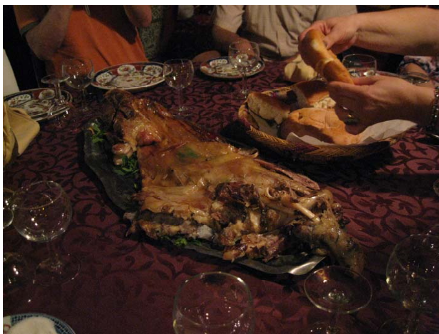
Вечера у Chez Ali

Град има нешто преко милион становника и по величини је четврти у Мароку. Име потиче из Берберског језика и значи „Божја земља“. Основао га је султан Јусуф ибн Тафрин први владар из династије Алморавида, 1062. године. Стари део града (медина) од 1985. године је на UNESCO – овој листи Светске баштине. Главне атракције у Маракешу су историјски трг Ђема ел Фна (Трг смрти), дамија Кутубија из 1162. године и више вртова (Агдал, Менара, ботаничка башта Мажорел).