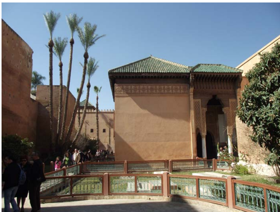
Гробница династије Сади

Преподневни обилазак Маракеша и његове медине завршавамо посетом традиционалној берберској апотеци, где нам помало досадни представник апотеке објашњава о њиховим производима. Успут рекламира своје производе који се углавном базирају на аргановом уљу. Уље се добија из коштица плодова аргановог дрвета које је ендемска биљка у Мароку.