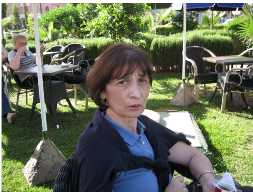
Одмор у Cafe Marjana

Ручамо у Бени Мелалу у ресторану звучног имена „Париз“. Споља не оставља утисак, али унутрашњост је сасвим у реду. Послужење је по систему „шведског стола“, храна је разноврсна и одлична. Једино се не усуђујем да пробам свеже поврће, јер још увек се присећам проблема из Египта и Израела од пре четири године. Ресторан је пун гостију, јер се изгледа ради о ресторану који своје услуге нуди бројним туристичким групама које овуда пролазе на путу из Феса у Маракеш.