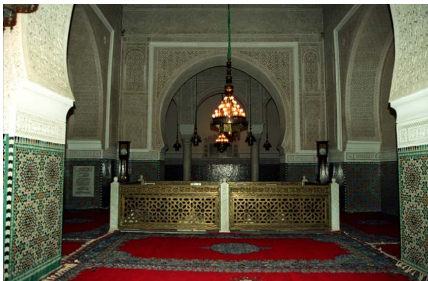
Гробница Мулај Исмаила

била је последњи градитељски подухват Мулаја Исмаила. По њеној зеленој боји Мекнес називају и „зеленим градом“. Мекнес је такође називан и марокански Версај, због екстраваганције свога градитеља.