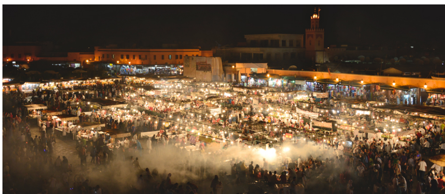
Ђема ел Фна ноћу

Преподневни обилазак Маракеша и његове медине завршавамо посетом традиционалној берберској апотеци, где нам помало досадни представник апотеке објашњава о њиховим производима. Успут рекламира своје производе који се углавном базирају на аргановом уљу. Уље се добија из коштица плодова аргановог дрвета које је ендемска биљка у Мароку.