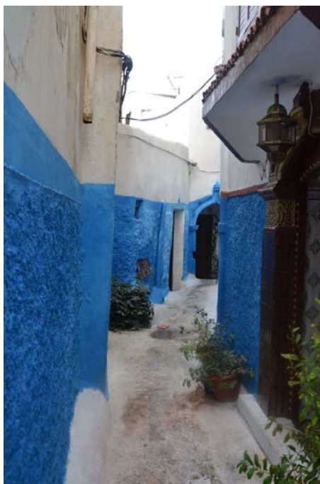
Улице Казба Удаја

Казба Удаја је питорескно место које се разликују од остатка града. Све куће су беле боје са парапетима плаве боје. Одавде се пружа чудесан поглед на Атлантик и Сале, Рабату суседни град. Ово је миран део града и релативно мало људи може се видети на његовим улицама.