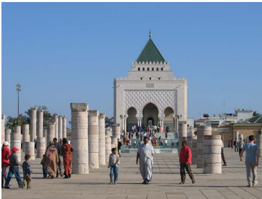
Маузолеј Мохамеда V

Преко пута незавршене џамије налази се Маузолеј Мохамеда V који је владао Мароком од независности 1956. године до своје смрти 1961. године. У Маузолеју се налазе гробови краља Мохамеда V и његова два сина, каснијег краља Хасана II и принца Абдулаха. Зграда се сматра ремек делом савремене архитектуре која прати владавину Алуитске династије. Има белу силуету са кровом у зеленој боји која је боја ислама. Маузолеј је завршен 1971. године, а краљ Хасан II је у њему сахрањен после смрти 1999. године.