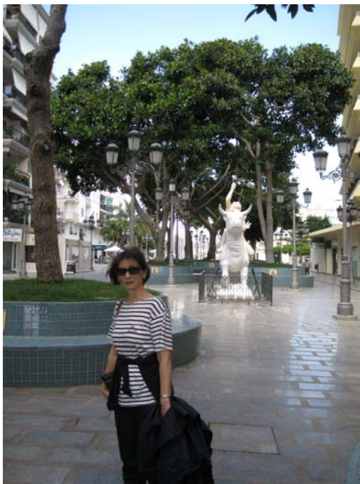
Торемолинос за растанак

Јутро последњег дана путовања освануло је сунчано. После доручка скокнули смо да Данка купи ципеле и ево нас у хотелској соби чекајући крај нашег боравка у хотелу „Cervantes”. На аеродром треба да кренемо у 18 сати, а сам лет је око пола девет. У подне се одјављујемо из собе и после седења у хотелском холу шетамо се Торемолиносом. Поново силазимо до обале, штета што време претходна дана није било као данас. Можда би се и окупали.