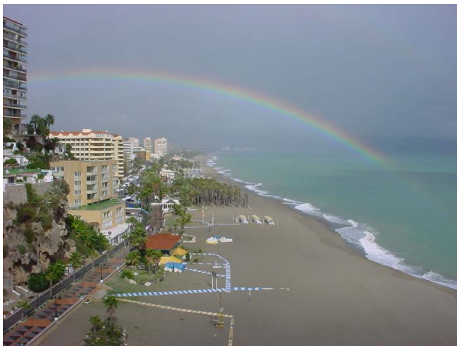
Плажа у Торемолиносу

Први дан нашег мини одмора на Costa del Sol. Време је прохладно па не размишљам о купању, чак ни у хотелском базену. Зато после доручка одлазимо у разгледање трговачке понуде Торемолиноса. Спуштамо се и до мора, које је прилично удаљено од нашег хотела, који се налази у самом центру градића. Или смо ми изабрали заобилазни пут који води до мора. Нажалост радње су углавном окренуте туристичкој популацији која већ сада опседа јужну обалу Шпаније.