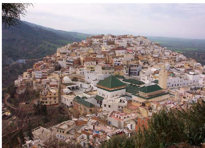
Панорама Мулај Идриса

У близини Волубилиса налази се градић Мулај Идрис где се налази гроб истоименог мароканског владара из VIII века. Мулај Идрис ( Moulay Idriss ) је иначе оснивач Феса и од њега је направио своју престоницу. На ове просторе он је дошао крајем VIII века доносећи са собом ислам и оснивајући нову династију Идрисида. По легенди отровали су га људи абасидског багдадског калифа Харуна ал – Рашида.