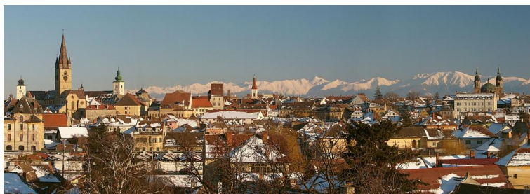
Сибиу – Панорама

Једна од знаменитости Сибиу је и Брукенталов национални музеј (Muzeul Național Brukenthal). Брукентал чије име носи музеј био је гувернер Трансилваније за време Хабсбуршке власти и прве колекције потичу из 1790. године