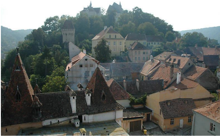
Горњи град у Сигишоари