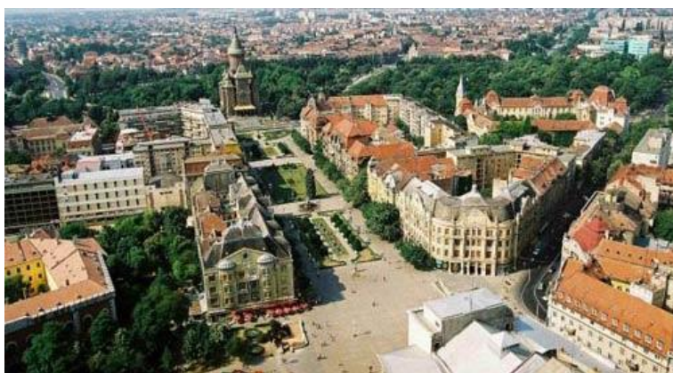
Поглед на Трг победе

Приликом сваке посете Темišвару откривао сам понеки ситан детаљ из његове историје и данашњег живота.