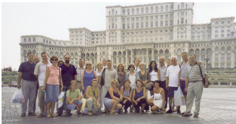
Снимак за успомену на Букурешт

Дан проводимо у обиласку знаменитости. Између осталог обилазимо и етно село, које представља највећи музеј на отвореном у Европи. Поподне користимо за „шопинг“. Више се ради о истраживању могућности шта се може купити него што се заиста купује. Обилазак завршавамо испред грандиозног здања Парламента.