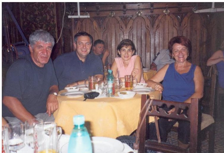
Снимак из ресторана „Кола пуна пива“

Увече одлазимо на вечеру у ресторан, чији би назив могао да се на српски језик преведе као „Кола пуна пива“