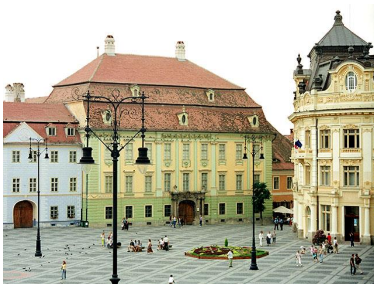
Брукенталов национални музеј

Једна од знаменитости Сибиу је и Брукенталов национални музеј (Muzeul Național Brukenthal). Брукентал чије име носи музеј био је гувернер Трансилваније за време Хабсбуршке власти и прве колекције потичу из 1790. године